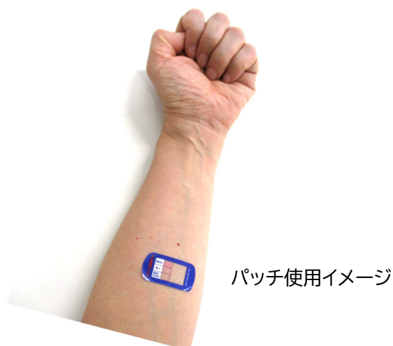
パッチ使用イメージ