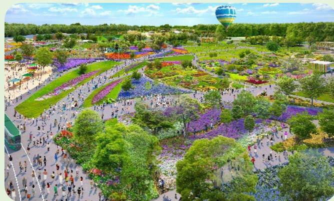
会場のイメージ（メインガーデン）

GREEN×EXPO 2027は、環境と共に生きる 未来を考える、“環共”をテーマとした、 日本で初めての国際博覧会です。 気候変動という、私たちの暮らしに深く 関わる大きな課題に向き合い、自然や技術、 文化を通じて、環境と調和した未来の暮らし を共に描いていきます。 子どもから大人まで参加できる体験を通して、 「地球と生きる準備」を始めるきっかけを 届けます。