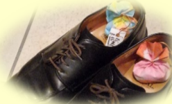
アロマストーン類