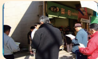
福祉施設見学会の様子

第3地区にある10か所(平成28年4月現在)の福祉施設を地域の方に知ってもらうために見学会を行っています。