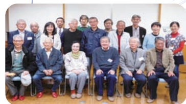
第3地区懇談会一同

取組部会での企画、地区懇談会での実践に是非ご参加ください。地域住民ひとりひとりの力を合わせて、いつまでも暮らしやすい第3地区をみんなでつくりあげていきましょう。