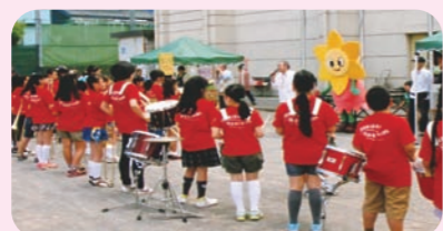
オープニングセレモニーで演奏する稲荷台小学校のブラスバンド

第3地区の顔の見える関係づくりのために、毎年5月の第3日曜日に稲荷台小学校で開催しています。