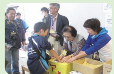
第3地区懇談会ブースの様子

毎年10月に生活創造空間にして開催されている福祉フェスタに第3地区懇談会としてブースを出展しています。スタンプラリーを行い、福祉施設の紹介をしています。