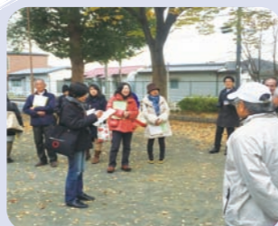
まちあるきの様子

第3地区懇談会では、地域の現状をふまえた計画をつくるためにまちあるきを行い、そこから見た第3地区に必要な取組をグループワークにより検討しました。