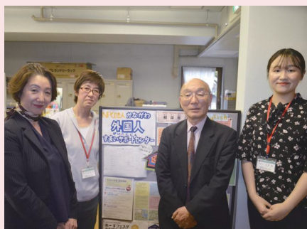
住宅支援中心的工作人员

可用以下9种语言提供咨询服务：英语、中文、韩语、菲律宾语、西班牙语、葡萄牙语、越南语、尼泊尔语、泰国语。