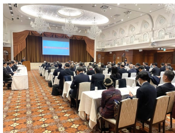
中区制100周年記念事業実行委員会 設立総会