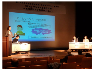
令和6年度中なかいいネ！発表会

第4期中区地域福祉保健計画（計画期間：令和3年度から令和7年度まで）に基づいて、誰もが安心して健やかに暮らせるまちを目指し、地域に住む人・働く人・関係団体の連携や取組を支援し、推進します。また、第5期計画（区計画・13地区の地区別計画）を策定します。