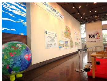
GREEN×EXPO 2027と一体となったPR (中区民祭り「ハローよこはま2024」)