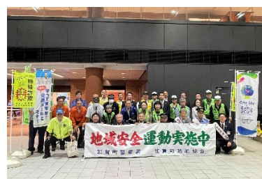
加賀町防犯協会キャンペーン

「中区民暮らし安全推進協議会」を中心として、区民・事業者・警察・行政等の関係機関・団体が一体となり、高齢者の被害が後を絶たない振り込め詐欺の防止や、近年増加している凶悪な強盗への対策など、地域の実情に応じた防犯の取組を推進します。