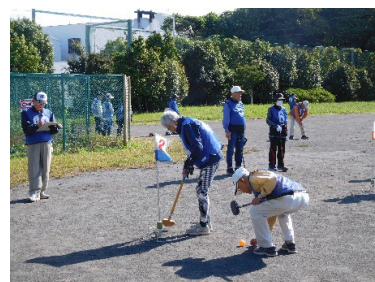
中区老人クラブ連合会 グラウンドゴルフ大会

高齢者の地域交流促進、地域での介護予防活動の推進など、支え合い助け合うまちづくりを進めます。また、認知症への理解促進や地域の見守り充実に向けた認知症サポーター養成を強化します。