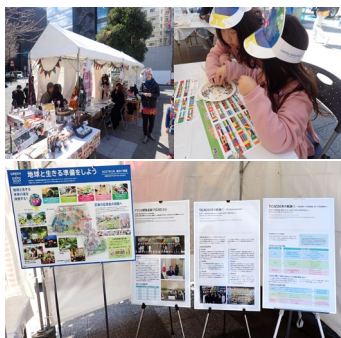
TICAD9とあわせた GREEN×EXPO 2027のPR