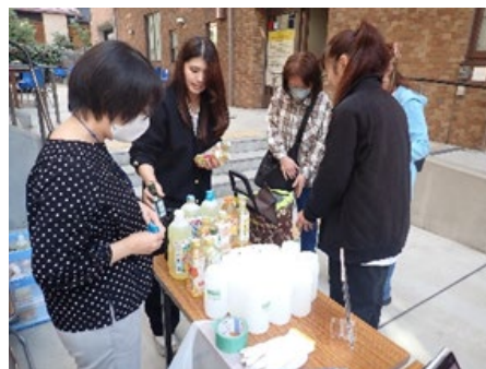
廃食用油回収(SAFへの変換) @中区SDGsマルシェ