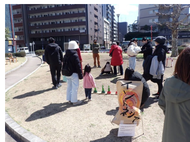
多文化共生交流イベント

中区多文化共生推進アクションプランのもと、国籍やルーツによらず誰もが地域の一員として、安心して自分らしく暮らせるまちを目指し、関係機関等と連携しながら多文化共生施策を推進します。また、令和8年度からの次期プラン策定に向けた検討を行います。