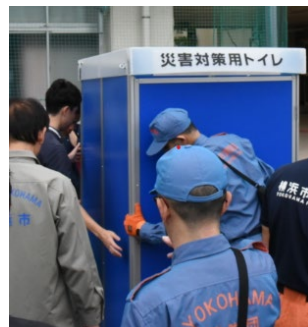
地域防災拠点訓練の様子

共同住宅の占める割合が多い地域特性（78%、62,800戸）を踏まえ、令和6年度より開始したマンション防災アドバイザー派遣制度を継続して実施します。また、災害時の担い手育成のため、区内小・中学生を対象とした防災出前教室を実施します。さらに、中区の地域特性に応じた防災訓練、災害対策事業を推進します。