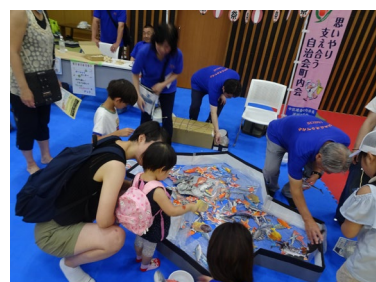
埋地ミニ夏まつり

※GREEN×EXPO 2027に向けた脱炭素チャレンジ事業、 中区制100周年(2027)記念事業は、次ページに記載