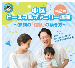
ピースフルファミリー講座

子育て中の方が身近な地域で安心して子育てができるよう、地域や家庭と連携して子育て支援に取り組みます。また、家族で子育てを楽しむための育児講座を拡充します。