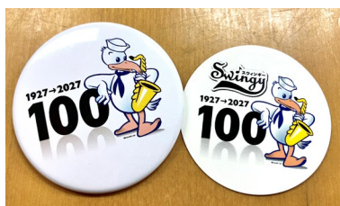
啓発グッズ (ピンバッジ・ステッカー)