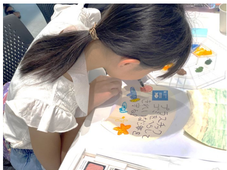
子ども向けの環境啓発講座