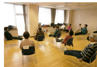
身体と脳に優しいストレッチ