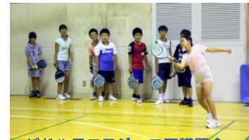
パドルテニスジュニア講習会

当地区センターの近隣には学校が多く、年代別利用者比率が、中学生 14%、高校生 11%（市平均 5～6%）と、非常に高い特徴があります。