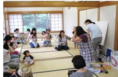
竹之丸保育園との共催事業（子育て支援）

という4つの「まちづくりの方向性」が挙げられていますが、これらは、まさに「地区センター」の設置目的にも合致するものであり、竹之丸地区センターの果たす役割は非常に大きいと考えます。そこで、当地区センターでは、本市重施策の実現に向けて以下の事業を進めていきます。