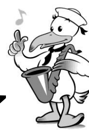
横浜市中区のマスコット スウィンギー