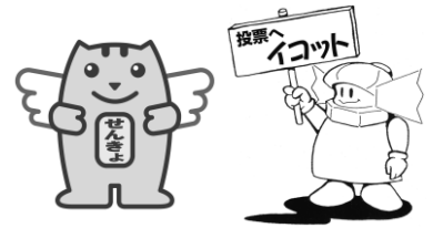
明るい選挙キャラクター 選挙のめいすいくん 横浜市選挙のマスコット イコット Jr.

https://www.city.yokohama.lg.jp/city-info/senkyo/