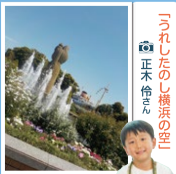
「うれしたのし横浜の空」