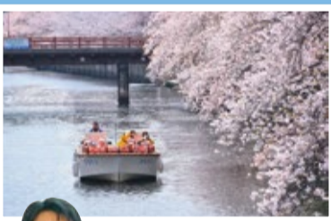
「桜雲の流れに乗って」

中区って「イイネ！」フォトコンテストに毎年応募してくれているご家族に聞きました。