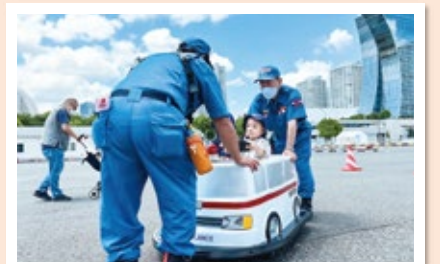
電動カー(消防車・救急車)の乗車体験も!