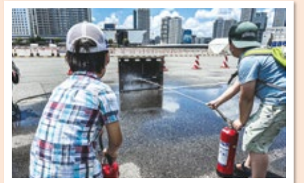
消火器を使ってみよう!