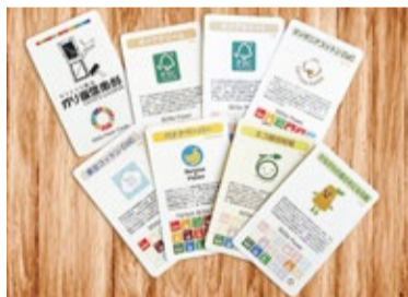
▲トレーディングカード

バナナペーパーや神奈川県の間伐材といった人や環境に配慮した紙を使った名刺、国産の木材チップで作られた紙製ストロー、紙製のエコファイルなどを販売しています。さらに、紙の素材について説明されたトレーディングカードなどを使い、啓発にも取り組んでいます。