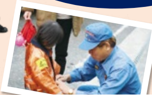
防火衣を着て 消防車と写真を撮ろう!