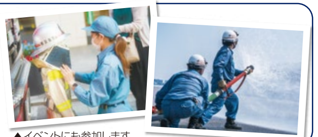
▲イベントにも参加します