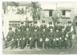
▲加賀町消防団第一分団

中区の消防団の始まりは、明治27年5月に横浜市に編成された3組(伊勢佐木・石川・山手)の消防組です。昭和23年には消防組織法の施行により消防団として新たにスタートし、中区では伊勢佐木・加賀町・山手の3つの消防団が活動しています。