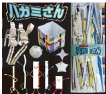
▲ハガミさんと作品例

また、印刷の工程で発生する端切れ紙や余剰紙を、パッケージして、「ハガミさん」という名前で商品化しました。さまざまな種類、長さの長方形の紙が入っていて、アート作品や夏休みの図工などに利用することができます。環境に優しい工作用紙「ハガミさん」はアイデア次第でステキな作品に生まれ変わります!