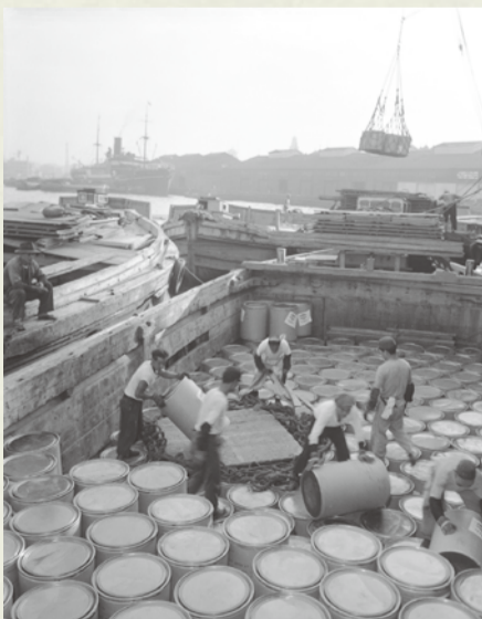
▲アメリカから贈られた脱脂粉乳の陸揚げ作業 1956年10月22日