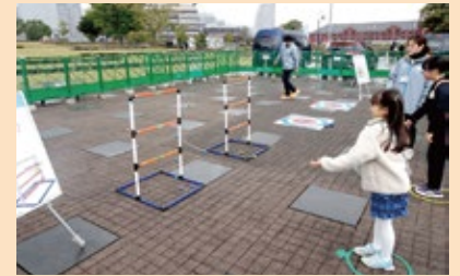
▲インクルーシブスポーツ体験