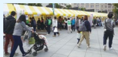
▲健康づくりを応援する複数団体が出店