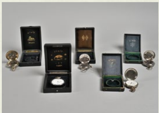
▲J.コロソ商会が取り扱った商館時計と収納箱 小川雄一コレクション・当館所蔵