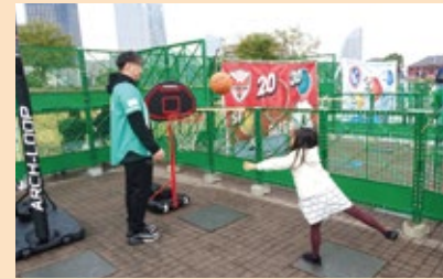
▲横浜エクセレンスブース

また、幅広い年代の人が参加できるインクルーシブスポーツ体験も開催します！体を動かして楽しみましょう！