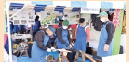
▲なか区民活動センター