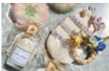
◀ワンヘルスラボ雑貨