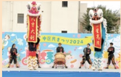
▲横浜中華学校校友会国術団