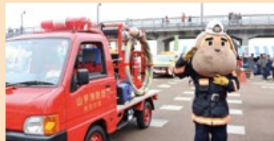
▲中消防署による車両展示