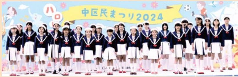
▲赤い靴ジュニアコーラス

見ている人も一緒になって盛り上げられるステージが多くあるので、ぜひBゾーンのステージへお越しください！