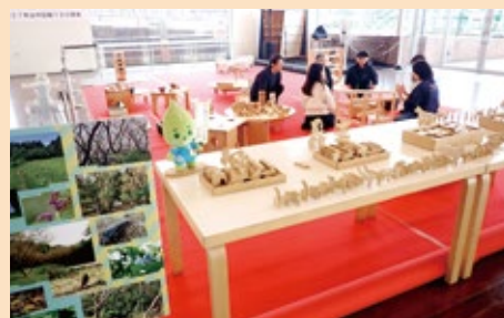
▲木育ワークショップの様子