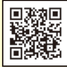
▲飯能まつりホームページ