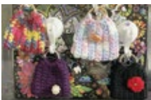
◀メタゲーム横浜雑貨