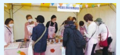
▲食生活の見直しと災害時の備えを紹介