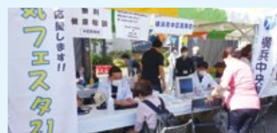
▲区医師会の医師による無料健康相談

ぜひこの機会に、未来の自分のために「健康づくり」の第一歩を踏み出してみませんか？