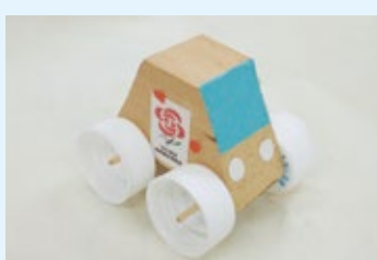
▲ワークショップ作品