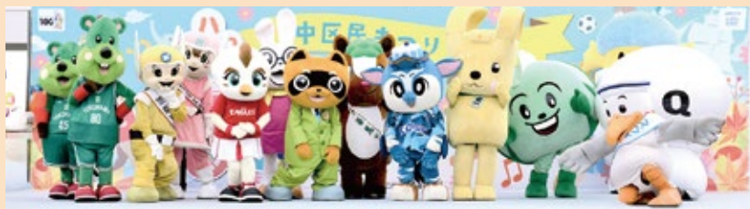
▲マスコット人気投票PR