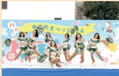
▲横浜エクセレンス専属チアリーダース Elegance