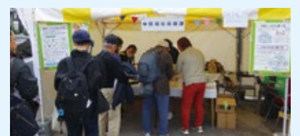
▲野菜摂取量チェック