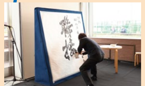
▲書道家 熊峰氏による揮毫(きこう)パフォーマンス