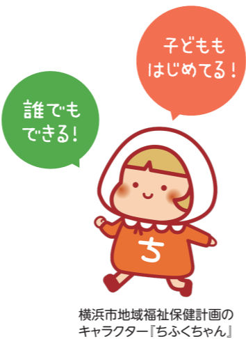
横浜市地域福祉保健計画の キャラクター「ちふくちゃん」

まちの掲示板をながめてみる、登校中の子どもとあいさつを交わしてみる… もしかしたら、すでにあなたが日ごろから取り組んでいることかも? 私たちのまちの「中なかいいネ!」は、こうした活動と、ちょっとした毎日の 支えあいで行われています。