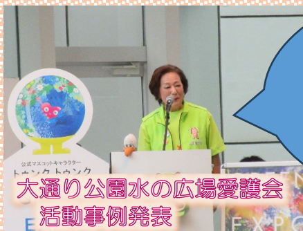
大通り公園水の広場愛護会 活動事例発表

たった一人から始めた愛護会活動が今ではたくさんの参加者が集まって活動をしてきているそうです。