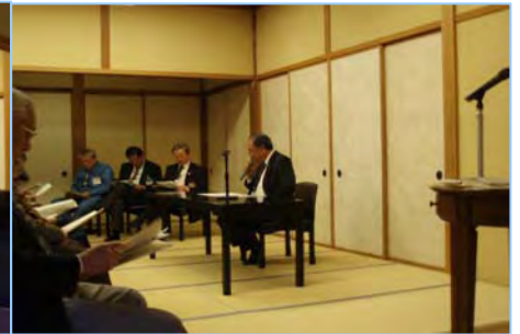
キリン園安西会長の事例発表