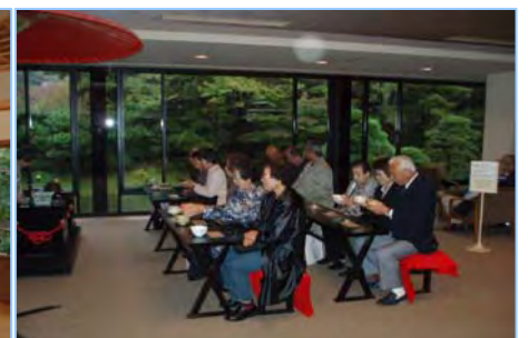
三溪記念館の抹茶処