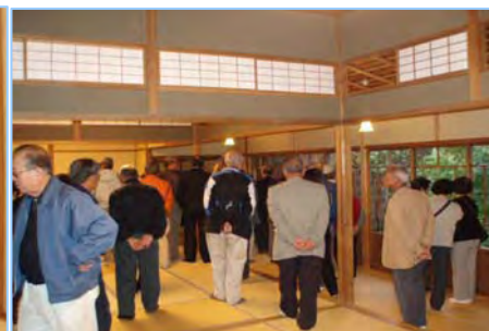
鶴翔閣の中の説明