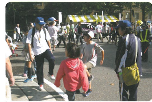
▲スポーツの楽しさを皆さんに知っていただくため活動しています!