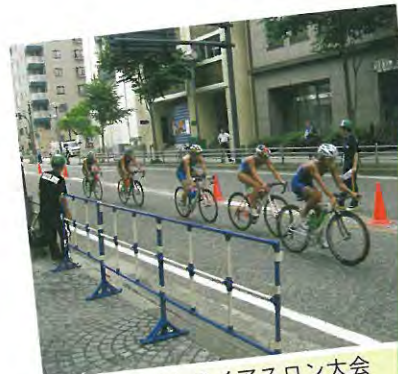
横浜国際トライアスロン大会