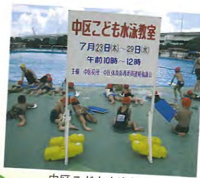
中区子ども水泳教室