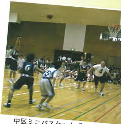
中区ミニバスケットボール大会