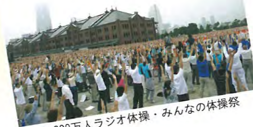
1,000万人ラジオ体操・みんなの体操祭