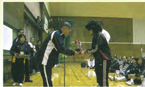
中区ソフトバレーボール大会