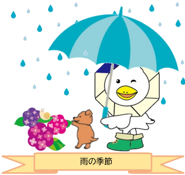
なか区民活動センターマスコット もなか