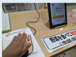
▲健康相談コーナー ベジチェック