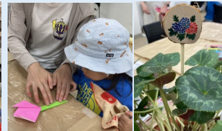
▲楽しいワークショップ