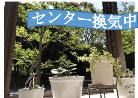
事務所から見える横浜公園の緑がとてもきれいです！