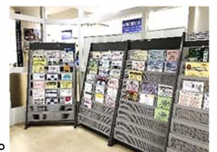
チラシ配架には基準があります

センターには毎日たくさんの情報チラシが届きます。来館者の欲しい情報を見つけやすいよう、チラシはジャンル別に見やすく並べています。休館中にチラシラックの数も増え、登録団体の発行するチラシも多く配架できますので、ぜひお送りください。