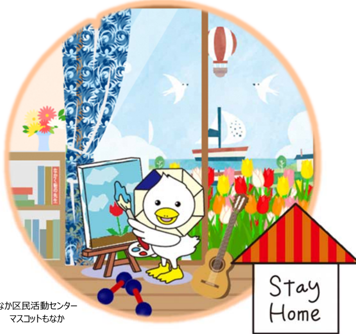
なか区民活動センター マスコットもなか

新型コロナウイルスの感染防止のため、なか区民活動センターは 5月6日(水)まで休館しています。 皆様にはご不便をおかけしますが、休館期間中は、 電話・Eメール・FAXによる対応のみ(平日9時~17時) となりますので、ご了承ください。