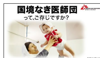
国境なき医師団の PR 動画のナレーションを担当