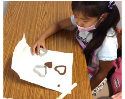
→ クッキー型で抜いて作成も