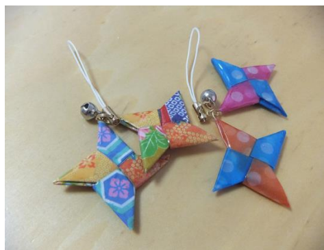
折り紙のレジン細工ストラップ