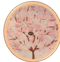
◀自分の出来るような事や目標を発表して桜を満開に