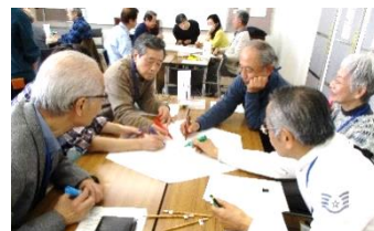
◀ ◀ 鍋会議風景

初めは自己紹介からスタートしたものの、限られた時間内では話さず物足りないほどの盛り上がりでした。自分のできる事に対して、他者が提案や出来ることに対して寄り添ってくれる事が、お互いを尊重しあえる関係づくりが良かったと思います。