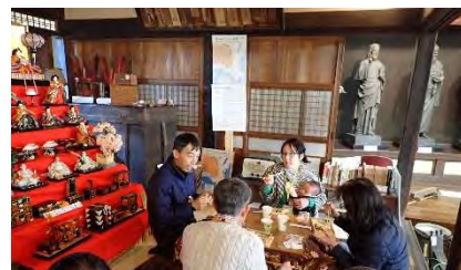
◀ 館長も交えてランチタイム