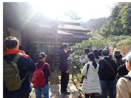
▲庭から見る風景は角度などから、建物内とは違って見えます