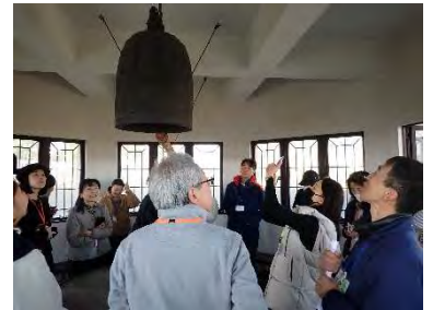
▲ 最上階には、見事な鐘楼