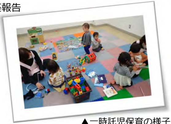
▲一時託児保育の様子