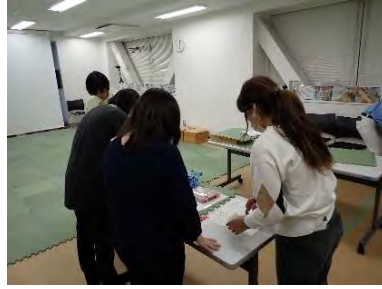
▲実行委員の打合せ