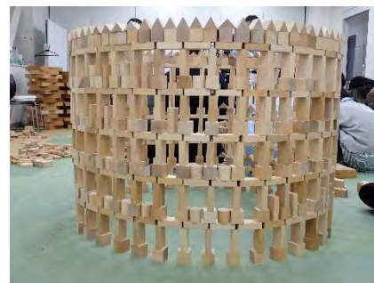
◀ライトを灯しました