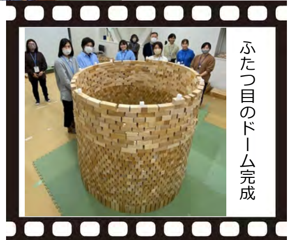
ふたつ目のドーム完成