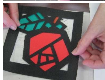
↑色紙を貼り付ける