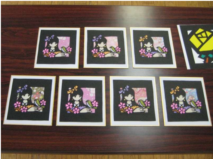
↑それぞれ春らしい切り絵が完成