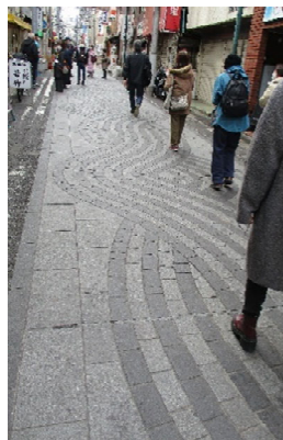
▲デザイン性がある野毛の石畳▲