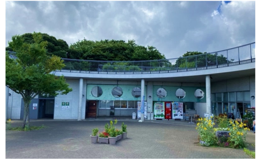
▲本牧山頂公園レストハウス