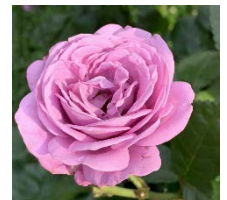
▼2グループにわかれてバラ園案内