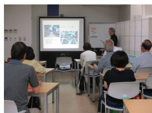
▲中区の歴史を地図から学ぶ