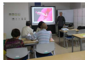
▲簡単で上手な写真の撮り方