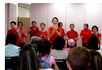
▲レッツ手話ダンス