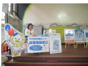
相談出張所も開設