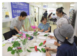
▲やさしい絵手紙の書き方