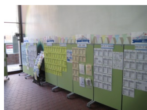
▲5月16日～ 区役所1階ばびぼ広場での展示の様子

平成28年度版「なかく活動ガイド」発行に伴い、活用・周知のPR及び市民へ向けて活動のきっかけづくりを目的に実施しました。この事業は、区民利用施設において活動する団体とセンターが連携し、中区全体の活動を盛り上げていく主旨で行いました。市民の方に実際に来ていただき、活動ガイドの拡大版を見ていただくことにより、身近に地域の活動団体の情報を知って参加するきっかけとなり、ダイジェスト版の活用につながったと思います。課題としては、全体的な集客については、恒例化していない単発のイベントだったので、広報の方法に工夫の必要性を感じましたが、当日の参加者もあり、団体同士の交流もおおむね良好でした。センターとしても実際の団体を知ることは、今後「活動ガイド」を紹介する、センターイベントに参加団体が増えるなどつながりの強みになると思います。