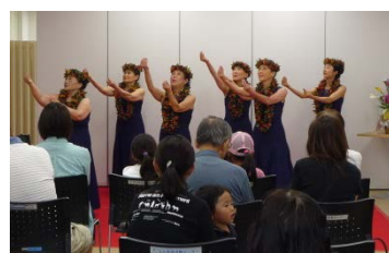
▲フラダンス・ウクレレ