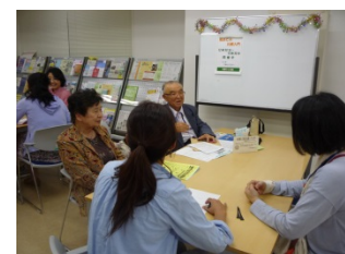
▲初めての川柳入門