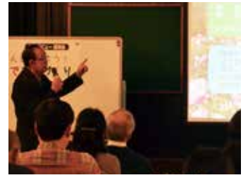
▲夕方からの開催ですが、会場は満席になりました。まず中区で活動する7サークルの活動紹介発表から始めました。