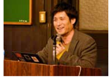
▼▲講演会の話題を、参加者の顔を見て決めることも。豊富な話題に笑いも入れながら参加者は楽しみながらひきこまれます。