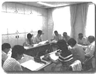
～本牧・根岸地区社協理事会～

地区社協を中心に計画づくりを進めています。地域の活動が活発になると、人と人とのつながりから様々な活動が広がります。お祭りや縁日、運動会、防災訓練、演奏会などを子ども達と一緒にしています。これからも世代間の交流を大切に、活動を続けていきます。