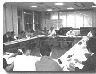
埋地地区計画推進会議 ～みんなの意見交換会～

まちの良いところ、もっと良くしたいところについて話し合う「埋地みんなの意見交換会」を開催しました。埋地地区の自治会町内会を中心に、埋地に住む人、活動する人みんなで、「こんなまちになるといいネ！」を考えていきます。