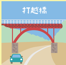
コース 6 P13-14

横浜三塔を一度に見ることができるポイントには、目印が設置されています。目印の設置場所は日本大通り、赤レンガ倉庫、大さん橋の3か所。横浜の特徴的な風景を、ウォーキングと併せて楽しんではいかがでしょうか。