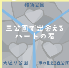
コース 3 4 5 P7-8,9-10,11-12

新聞やアイスクリームなど、様々な『発祥の地』がある横浜ですが、実は日本で最初のフットボール（ラグビー）クラブ設立の地でもあります。中華街の一角には記念碑が設置されており、当時のエピソードを知ることができます。