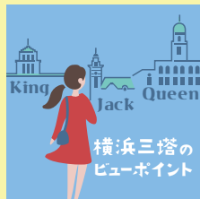
コース 1 P3-4

ウォーキング中、横浜税関の前を通りかかったら、少し視線を上げてみてください。晴れた日の昼間であれば、海岸通りを挟んで向かい側のビルのガラス面に、映りこむクイーンタワーの姿を見ることができます。