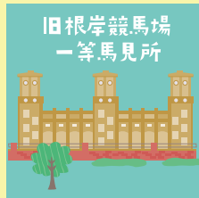
コース 8 P17-18

本牧神社では、毎年8月に本牧神社例祭の神事である『お馬流し』が行われています。神奈川県無形民俗文化財にも指定されている、歴史のある祭礼行事です。茅で作った『お馬さま』に、あらゆる災いを託して海に祓いやります。