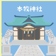
コース 7 P15-16

乙女坂は地藏坂の中腹付近、蓮光寺の横から始まる階段坂です。山手地区にある2校のプロテスタント系女子校（横浜共立学園、横浜女学院）に向けて作られた坂道で、坂名は両校の女学生が使う通学路であることに由来します。