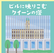
コース 3 P7-8

横浜公園、港の見える丘公園、大通り公園の石畳の中には、それぞれハートの石があるをご存知ですか？ 下を向いて歩いてみれば、周辺の石畳に溶け込む、可愛らしい形を見つけることができます。ぜひ探してみてください。