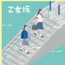
コース 6 P13-14

鮮やかな朱色とアーチが特徴的な打越橋は、昭和3年に竣工され、その歴史と景観から『横浜市認定歴史的建造物』として認定されています。また、夜にはみなとみらい地区の高層ビル群の夜景を望むことができます。