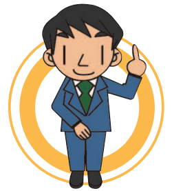
横浜市在住 Nさん 禁煙歴 1年

あとは、 タバコを吸っている人を見ると「うらやましい」と思ってしまうが、逆に「実はタバコをやめたいのにやめられないかわいそうな人だ」と思うようにすることも工夫の一つです。一緒に頑張りましょう！