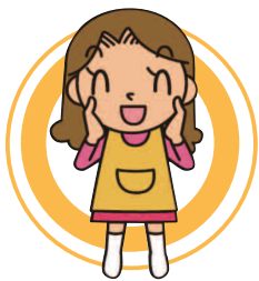
横浜市在住 Mさん 禁煙歴 7年

禁煙のきっかけは、人それぞれです。何度失敗しても、いろいろきっかけをつけてチャレンジしてください。いつか、必ず成功できますよ！がんばりましょう！