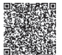
▲親子のひろば 年間スケジュール

地域を支える縁の下の力持ちである民生委員。その中でも児童福祉を主に担当する民生委員を「主任児童委員」と言います。