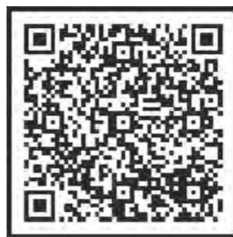
▲中区民生委員・児童委員 ホームページ

令和4年12月1日に県民ホールで171名の民生委員*が委嘱されたよ! 民生委員について詳しく知りたい方は左の二次元コードを読み取ってね!