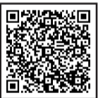
▲親子のひろばの年間スケジュールについてはこちら

親子のひろばには、保育士やのんびりんこ(地域子育て支援拠点)のスタッフも来ています。自治会町内会館など、区内4か所で定期的に開催しているので、ぜひ遊びに来てください!