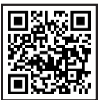
▲民生委員・児童委員についてもっと詳しく知りたい人はこちら

お住まいの地域を担当している民生委員・児童委員や主任児童委員について知りたいときは、区役所運営企画係までお問い合わせください。