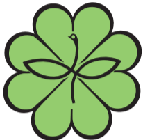
民生委員・児童委員の マーク※

民生委員・児童委員(以下「民生委員」という)は、「住民の立場」で地域福祉のために無報酬で活動しているボランティアで、特別職の公務員です。民生委員であれば必ず児童委員を兼ね、各自治会町内会から推薦を受けて、厚生労働大臣から委嘱されます。主任児童委員は児童福祉を専門に扱う民生委員です。中区の民生委員は174名(うち主任児童委員が22名)です。