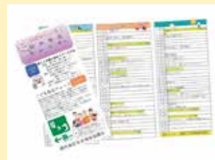
イベントカレンダー

災害対策や地域のつながり作りなど今ある取組を大事に続けていきます。また、区内でも高齢化が進んでいる地区であるため、地域の見守り力を高め、一緒に地域の活動を支えてくれる人の輪を広げていきます。