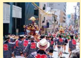
子の大神例祭連合渡御

今後も顔の見える関係、地域のつながりや見守り力を大切にします。地域の外国籍の方との交流を進め、地域行事や災害時の担い手としても期待しています。