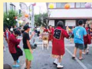
千代崎町四囃子連