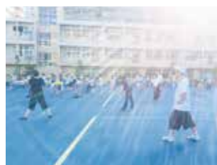
夏休みラジオ体操

青少年指導員やスポーツ推進委員を対象に、中区主催のラジオ体操講習会を開催し、地域指導者の育成を行いました。