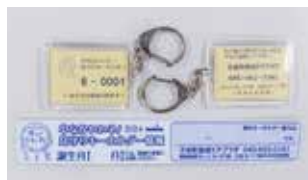
見守りキーホルダー

いざという時の連絡先が書かれた“見守りキーホルダー”の取組を通して、高齢者を地域全体で見守る仕組みづくりが進んでいます。平成30年度からは対象者を75歳以上から65歳以上に拡大しました。