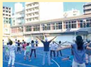
ラジオ体操(旧富士見中学校跡地)

ラジオ体操や防災訓練の中国語のポスターなどを通じて、外国籍の方も参加し始めてきています。今後も外国籍の方が多い地区として、多文化共生も視野に入れ地域づくりを進めていきます。