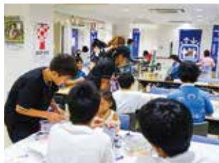
中なか子ども夏祭りの様子

平成 28年度より学齢期児童へ向けた支援事業を開始しました。生活体験の少ない児童等が楽しみながら生活スキルを学ぶ機会となっています。