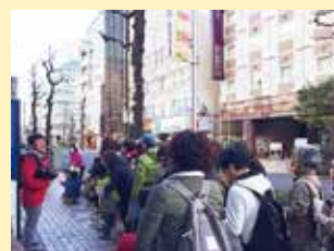
関内防災ウォーク