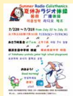
ラジオ体操ポスター

ラジオ体操だけでなく、地域の催し、行事のお知らせには、これからも多言語での広報を実施し、より多くの様々な地域住民が参加できるようにしていきます。