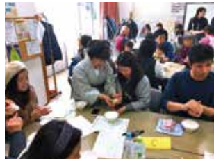
多文化交流会 (おにぎりづくり)

「多文化交流会」を実施した地区では、地域の自治会町内会やヘルスメイト等の協力・連携のもと、地域の外国籍の方々と交流を図ることができました。