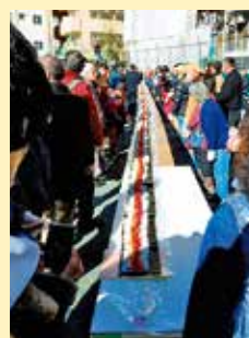
寿ふくしまつりの太巻き作り