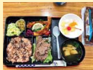
健康会食会 200回記念の食事

夏休みの一週間、地区連合町内会を中心にラジオ体操が賑やかに開催され、幅広い世代の方の参加がありました。こうした様々な活動を通じ、高齢者・子どもの見守りに地域全体で取り組んでいきます。