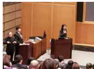
災害時要援護者支援講演会

災害時の避難行動や避難生活に支援を必要とする方々への理解を深め、地域での助け合いが円滑に行われる一助となるよう、災害時要援護者支援の説明会と講演会を開催しました。