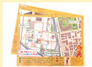
コトブキンちゃんのとくてくけんこうマップ

寿地区にはたくさんの社会資源、情報がありながら、地域住民にその情報が有効かつ即効性を持って提供されていない実態があります。(回覧板もないので…) 色々な情報を必要とする人たちが必要なときに情報が得られるように、町の中に掲示板を設置して、情報を通じて今まで以上に住民と住民とのつながりが生まれ、そこから新しい縁が生まれるようなまちを目指したいと思っています。