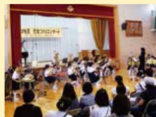
第3地区元気づくりコンサート