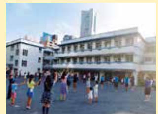
ラジオ体操(本町小学校)

外国籍の方が増えていることから、ラジオ体操やお祭り、運動会等の「多言語チラシ・ポスター」を作成しました。「自分たちの町内でも、こんな活動を取り入れたい」、「多言語ポスターを作成したい」と言った声が広がっています。給食会や地域行事に初めて参加してくれる方も出てきました。