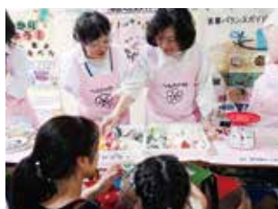
イベント：食育マルシェ

市内農家や企業との連携により、野菜摂取向上や地産地消を普及するためのイベントを行いました。