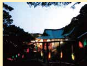
本牧山頂公園ライトアッププロジェクト