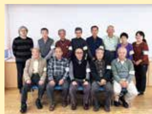
困りごと引き受け隊