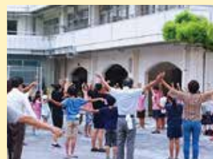
ラジオ体操（横浜吉田中学校）

30年度の案内チラシには、地域に住む外国籍の方々にも参加いただけるよう、中国語、英語、韓国語等の多言語での表記を加えました。