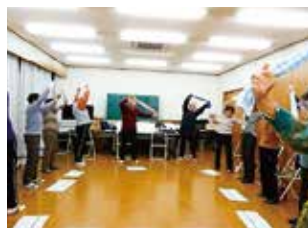
元気づくりステーション(体操)

高齢者が地域で人とつながりながら、介護予防・健康づくりを行う場が地域の中で増えました。地域ケアプラザでは、住民からの集会所等の活用や集いの場、見守りについての相談を受け、地域の中で活動できるまでのサポートを行いました。