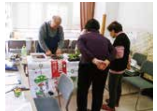
ケアプラザに出張して包丁研ぎ

高齢者世帯や障害者の方を対象として、暮らしのなかの“ちょっとした困りごと”を支援するために「生活支援ボランティアグループ生活支援KBT(希望の友)」が平成30年1月に発足しました。