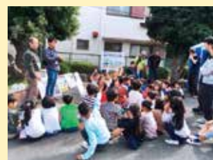
地域防災拠点運営訓練