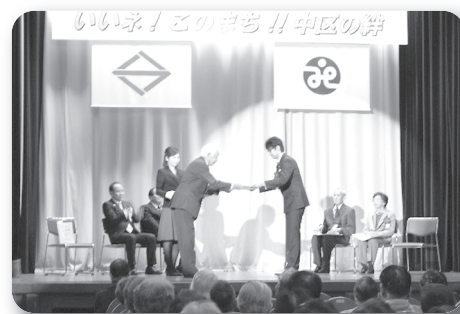
受賞者の皆様、おめでとうございます！