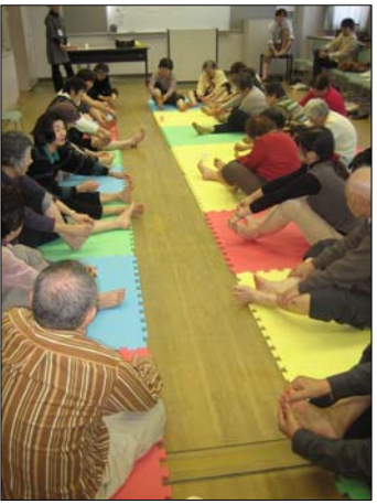
地域の生活課題解決に取り組む講座