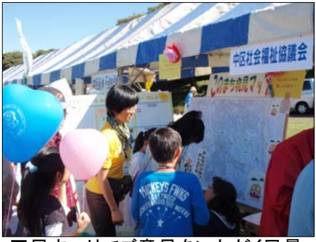
区民まつりでご意見をいただく風景