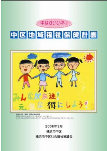
第1期 中区地域福祉保健計画「中なかいいネ!」冊子