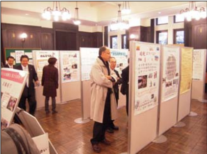
地域の活動紹介の様子