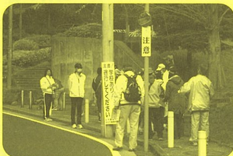
～健脚コースも・・・～