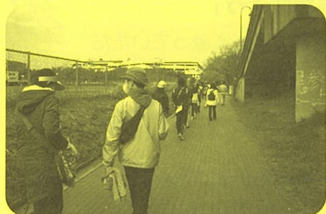
～みんなで歩きます～