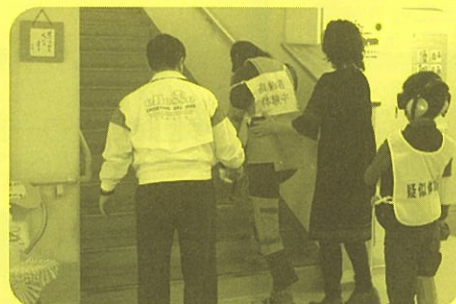
～高齢者疑似体験中～