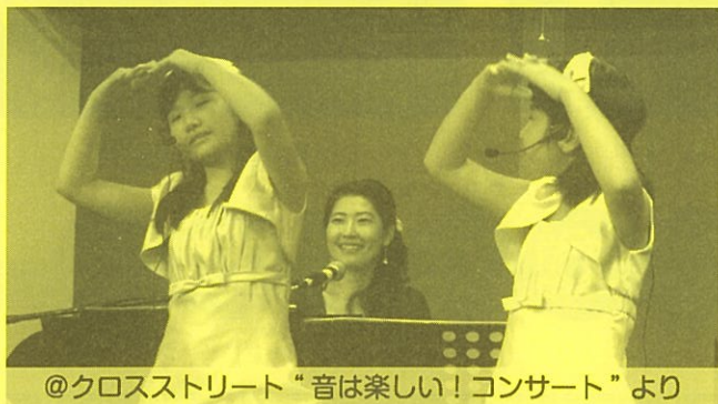
@クロスストリート“音は楽しい！コンサート”より

今回は、その一部をご紹介します。皆さんも気軽に口ずさんで、“小さなおせっかい”の輪を広げていきましょう！