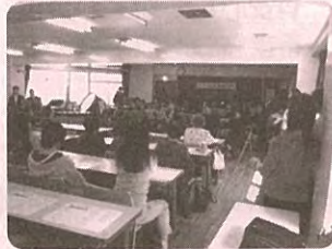
地区内のサロン (ふれあい東部)