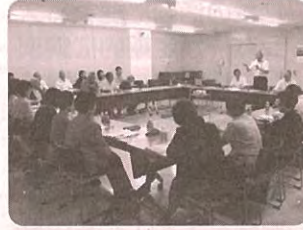
民生委員児童委員・連合町内会 合同研修会