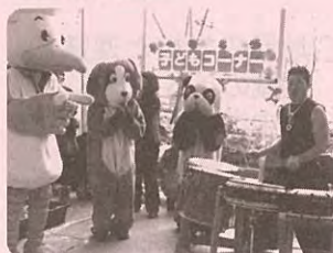
地域ふれあいまつり