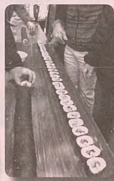
巨大のり巻き 21m (記録更新！)