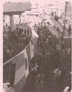
ことぶき福祉まつり