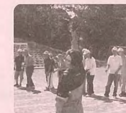
～スターター頑張ってます！～