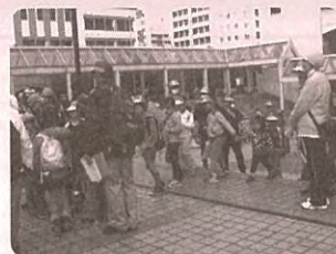
春のウォークラリー & 健康の日