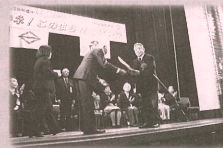
受賞者の皆様 おめでとうございます！