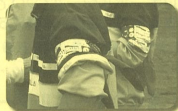
～腕に「バンダナ」を着けた生徒さん～