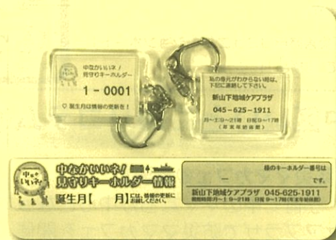
～キーホルダー&マグネット～

中区内の地域ケアプラザでは、ご本人にあらかじめ緊急連絡先などの情報を登録いただくと、登録番号が記載された外出用の「キーホルダー」と自宅用の「マグネット」を無料でお渡ししています。緊急時には、地域ケアプラザが登録番号をもとに、救急隊や病院などに適切な情報提供を行います。