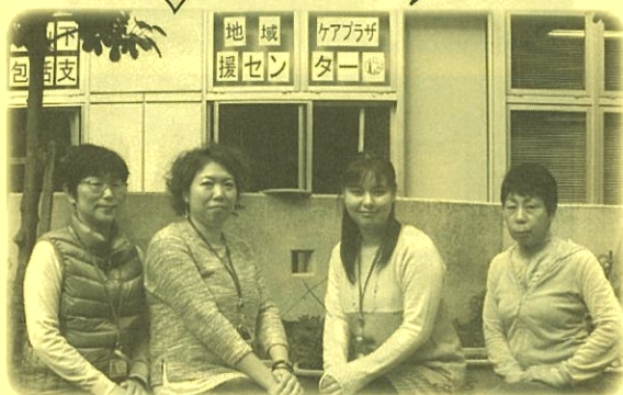
～地域ケアプラザのみなさん～

「キーホルダーをきっかけに、ケアプラザという相談先ができました。」という声が嬉しかったです。