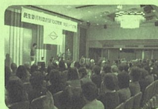
[12月4日記念式典の様子]

お二人はそれぞれの経験から「寄り添う」という共通の思いにたどり着かれていました。今回のお二人をはじめ、民生委員の方々は寄り添いの思いで「あなたのそば」で活動されています!!