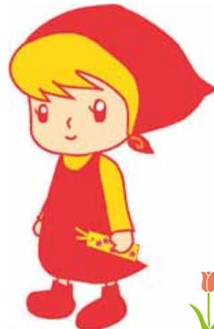
コトブキンちゃん