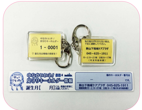
《キーホルダー&マグネットの写真》

A. お名前、住所、性別、生年月日、電話番号、緊急連絡先、かかりつけ医療機関、病歴等、要介護認定、ケアマネージャー・事業所名等