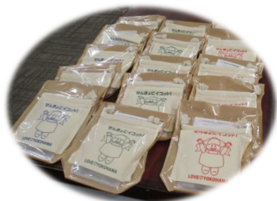
▽記念品の繰り返し使えるカイロ