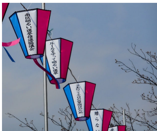
過去の桜まつりのぼんぼり