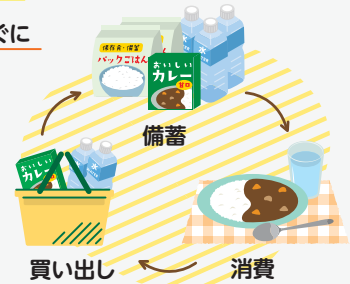
ローリングストック

食べ慣れたレトルト食品や缶詰などを少し多めに買って置き、毎日の生活で使いながら備蓄できる ローリングストック を心掛けましょう。