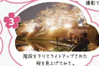
3 階段を下りてライトアップされた桜を見上げてみて。