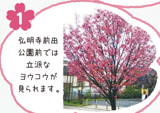
1 弘明寺前田公園前では立派なヨウコウが見られます。