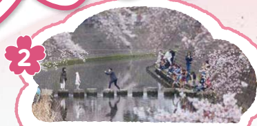
2 ぴよんぴよん岩は大人気。