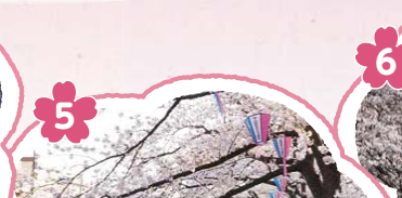
5 歩道を覆う桜がトンネルのよう。