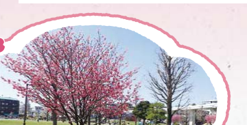
7 さまざまな種類の桜が見られます。ベンチもたくさんあるので休憩するの◎。