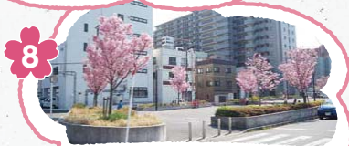
8 富士見川公園ではヨコハマヒザクラが一足先に咲き出します。