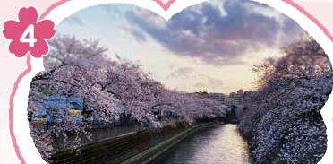
4 川面と両岸の桜を撮影できるフォトスポット♪