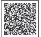
コースマップ 二次元コード▶

☎ 南区スポーツ推進委員連絡協議会事務局(区民活動推進係内) ☎ 341-1237 📠 341-1240