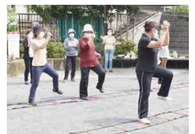
頭を使いながら楽しく運動。周りのみんなも手拍子で応援!▲

健康づくりだけでなく、地域の見守りにもつながっています。「参加者が運営のサポートをするなど、みんなで協力して運営しています。楽しみながら、長く続けていきたいですね」と、皆さんが笑顔で話してくれました。